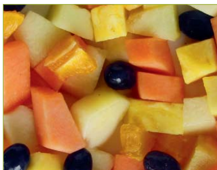
Fruchtsalat Salade de fruits Macedonia di frutta