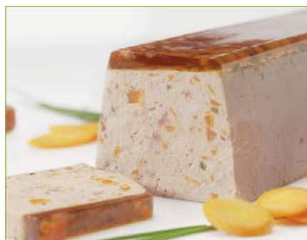
Hausterrine CH Terrine de maison CH Terrina della casa CH