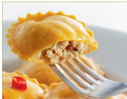
All'arrabiata-Ravioli CH Ravioli all'arrabiata CH Ravioli all'arrabiata CH