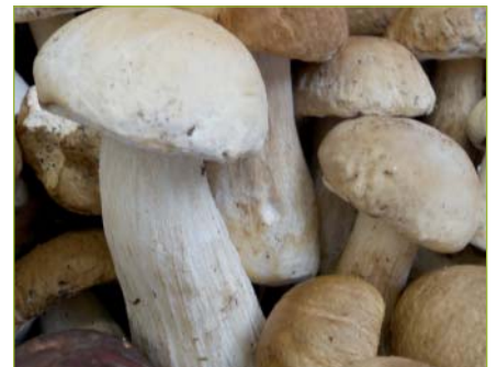
Steinpilze Bolets Funghi porcini