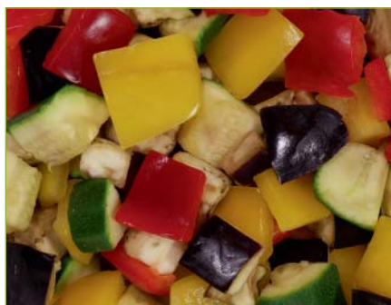
Ratatouille Ratatouille Ratatouille