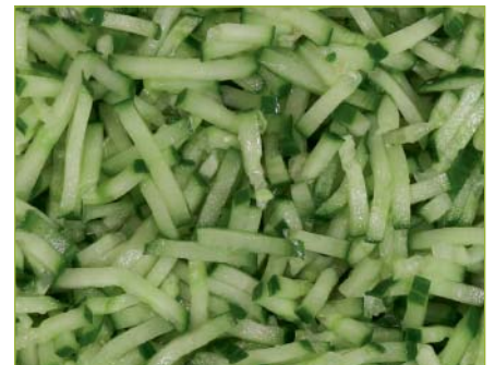
Gurken Julienne ungeschält

Salade californiana Insalata californiana