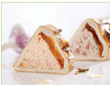
Dreieck-Pouletpastete CH Pâté de poulet triangle CH Paté al pollo triangolare CH