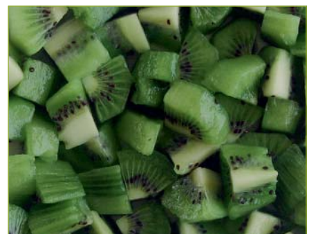
Kiwi Würfel Kiwi en cube Kiwi a cubetti