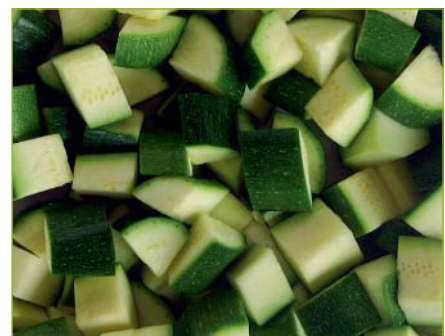
Zucchetti Würfel Courgette en cube Zucchine a cubetti