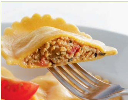
Caprese-Ravioli CH Ravioli caprese CH Ravioli alla caprese CH