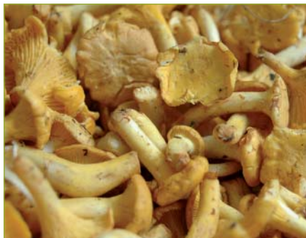
Eierschwämmli Chanterelles Gallinacci