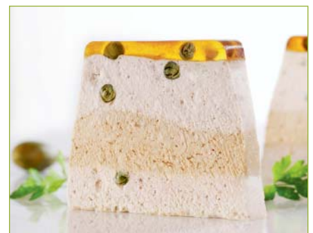
Terrine Vitello Tonnato CH Terrine vitello tonnato CH Terrina vitello tonnato CH