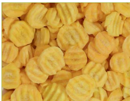
Pfälzkarotten Demidov Carotte jaune demidov Carote gialle demidov