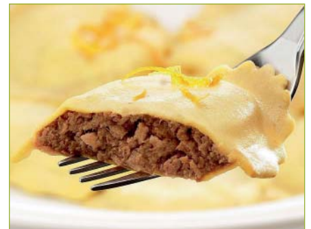
SwissPrim Brasato-Ravioli CH SwissPrim ravioli brasato CH SwissPrim ravioli brasato CH