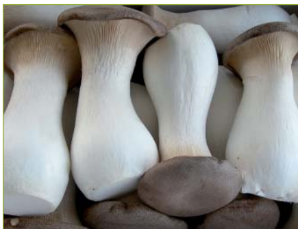
Kräuterseitlinge Latéral Cardoncelli